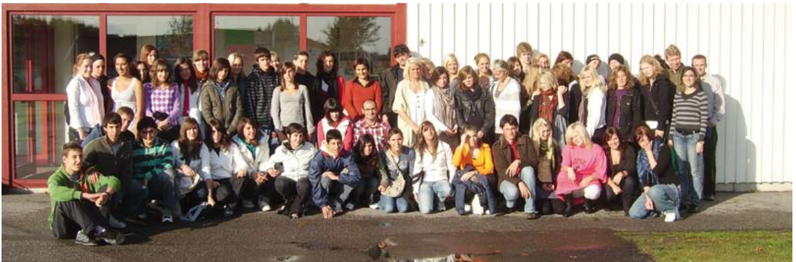
Last day farewell