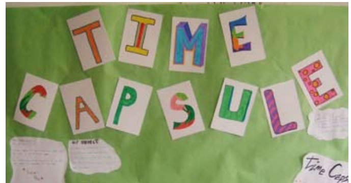
Time capsule display heading

Our school, Virgen del Espino, became one of her first destinations. Her visit in May was in the middle of our year 1 history project. What could we do that would be interesting for our pupils and that would immerse them in the idea that history is ongoing, and not just something to be read about?