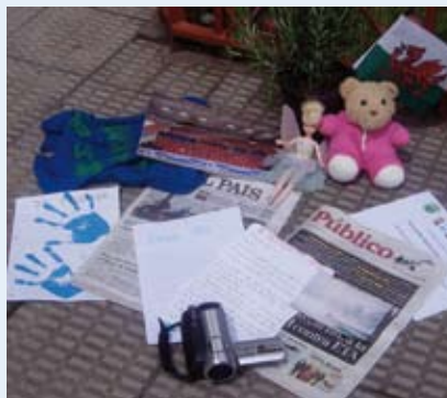
¿Qué contiene la cápsula?

Entre los ocho objetos elegidos se encontraban: un diario; una muñeca y un osito, que representaban la superación de la