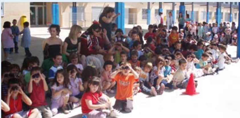
Con prismáticos no nos perdíamos nada

Propusimos a los alumnos juegos tales como el cricket, la rayuela y la costumbre de tomar el té por la tarde. Pero lo que realmente cautivó la imaginación de los pequeños fueron las carreras de caballos. Organizamos una carrera como las de Ascot y los chavales disfrutaron sólo pensando en ir a toda velocidad a lomos de un caballo, aunque fuera de madera.