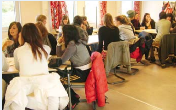
Trabajando en clase

“Aprendimos una cultura diferente y además practicamos el inglés. Es más fácil hablar inglés en Suecia que en España, porque la mayoría de las series de televisión y de las películas se proyectan en versión