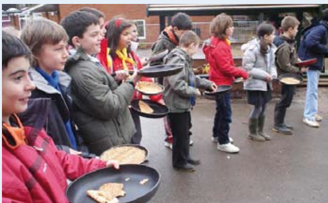
La carrera del “Gran Pancake”

Jueces de Castilla es un colegio que desde hace cuatro años está hermanado con el colegio Camelsdale en Gran Bretaña. Durante todo este tiempo, los alumnos han mantenido contactos periódicos y han realizado proyectos haciendo uso de las tecnologías de la información. En febrero de 2008, un programa de intercambio permitió a los alumnos conocer directamente la forma de vida y cultura en el Reino Unido. La visita a lugares de interés les dió la oportunidad de desarrollar conocimientos y habilidades sociales fuera del entorno de clase.