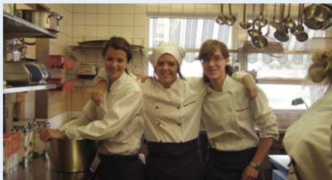
¡Cocinando la cena!