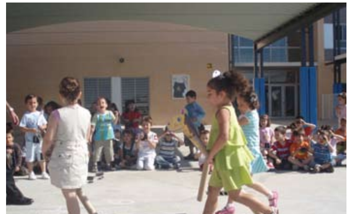
A last effort to get to the finishing line