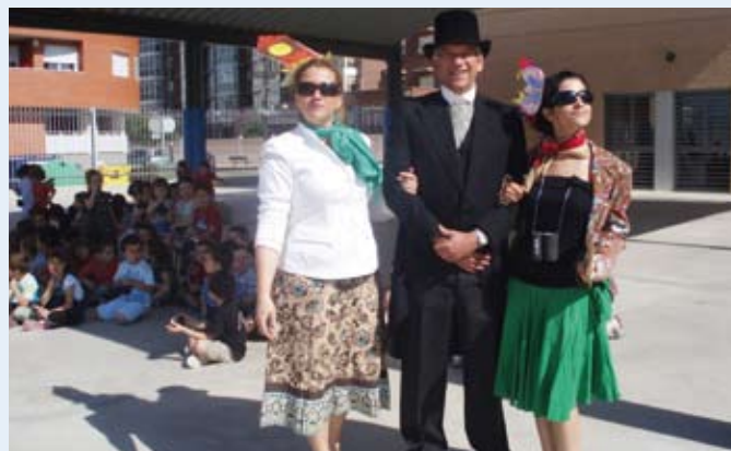
Un ejemplo de la moda de Ascot

Organizamos nuestra propia carrera de clasificación con 25 alumnos de cuatro y cinco años. Nos vestimos según la costumbre