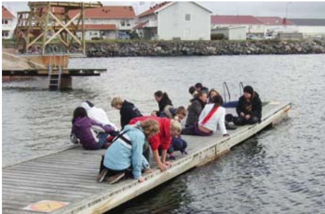
A crab fishing competition