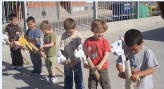
Preparados, listos, ¡ya!

E n la mayoría de las clases de inglés se estudian tradiciones británicas tales como el cambio de guardia en Buckingham Palace, Papá Noel y la noche del 5 de noviembre, denominada “Bonfire Night”. Pero durante el curso de verano que celebramos en St. Paul en Brighton, decidimos hablar de otras que no eran tan conocidas.