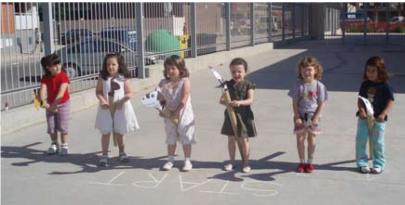
Ready, steady, go!