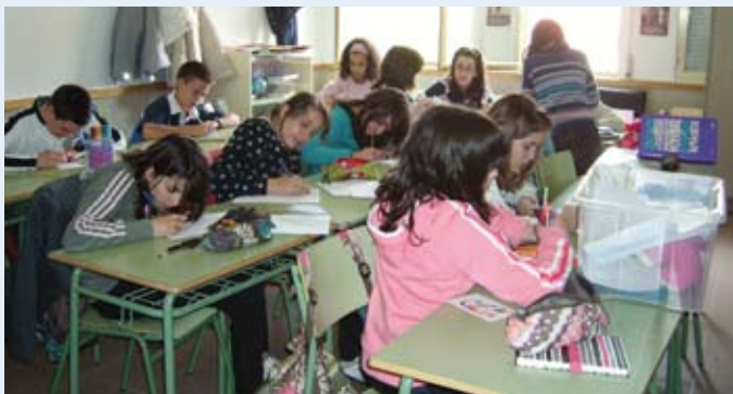
Carta a mí misma en el futuro