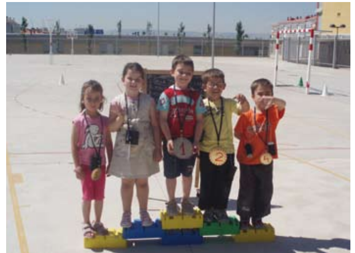
Our winners on the podium

• To see a video and photos of this experience, visit our website at http://cpaarzar.educa.aragon.es/