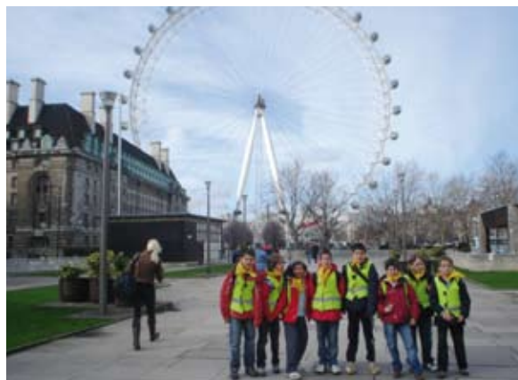
At London Eye