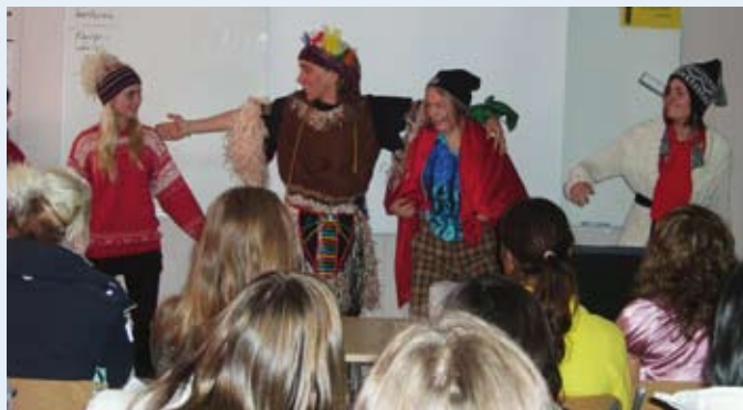
El Comité de bienvenida sueco