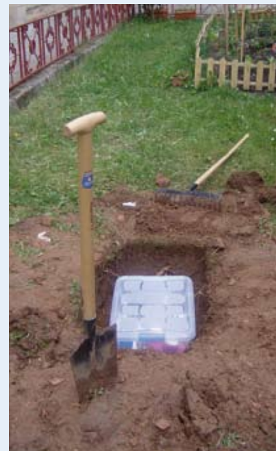
Enterramos la caja

Hemos quedado en reunirnos para desenterrar la cápsula dentro de 25 años. Os invitamos a todos a venir. ■